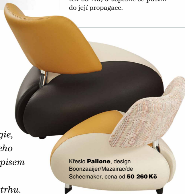
Křeslo Pallone , design Boonzaaijer/Mazairac/de Scheemaker, cena od 50 260 Kč

Designový nábytek značky Leolux je na českém trhu spíše opomíjenou značkou, přestože ve světě patří dlouhodobě ke špičkám ve svém oboru. Precizní řemeslo, nové technologie, design, který počítá s osobním přístupem k zákazníkovi a jeho vkusu, a snaha vytvořit pohodlný nábytek s výrazným rukopisem přinesly nové moderní linii holandského výrobce nábytku s dlouhou tradicí úspěch, který jistě brzy získá i na českém trhu.