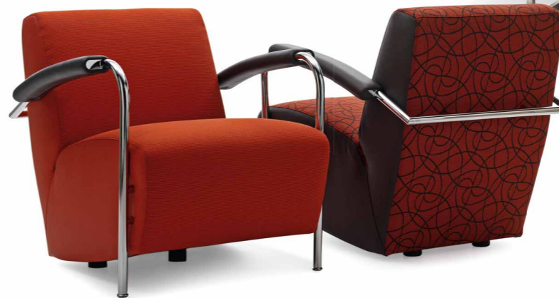
Křeslo Scylla , design Gerard Vollenbrock, cena od 55 860 Kč