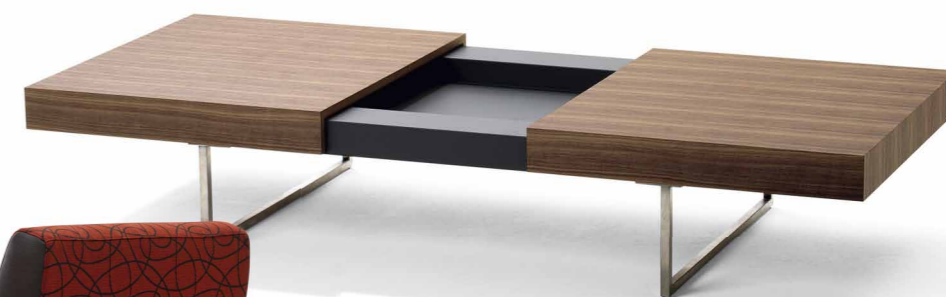
Rozkládací kávový stolek Tablet , tři různé typy, deska 140–90 x 80 cm, výška 33 cm, design Hugo de Ruiter, cena od 57 960 Kč