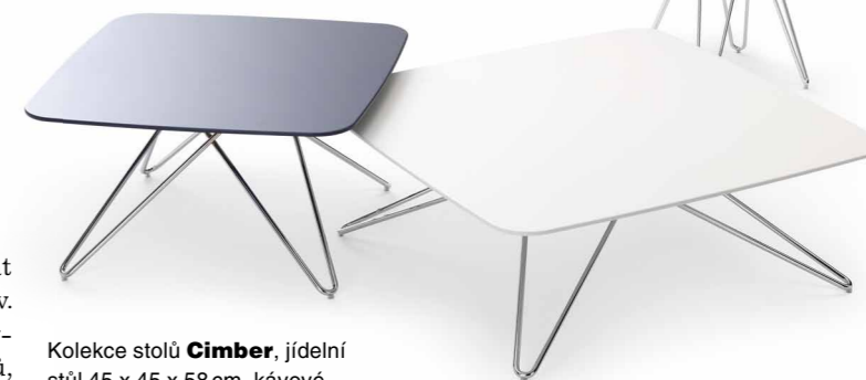
Kolekce stolů Cimber , jídelní stůl 45 x 45 x 58 cm, kávové stolky 70 x 70 x 38 a 90 x 90 x 38 cm, design Frans Schrofer, ceny od 16 600, 21 980 a 27 300 Kč